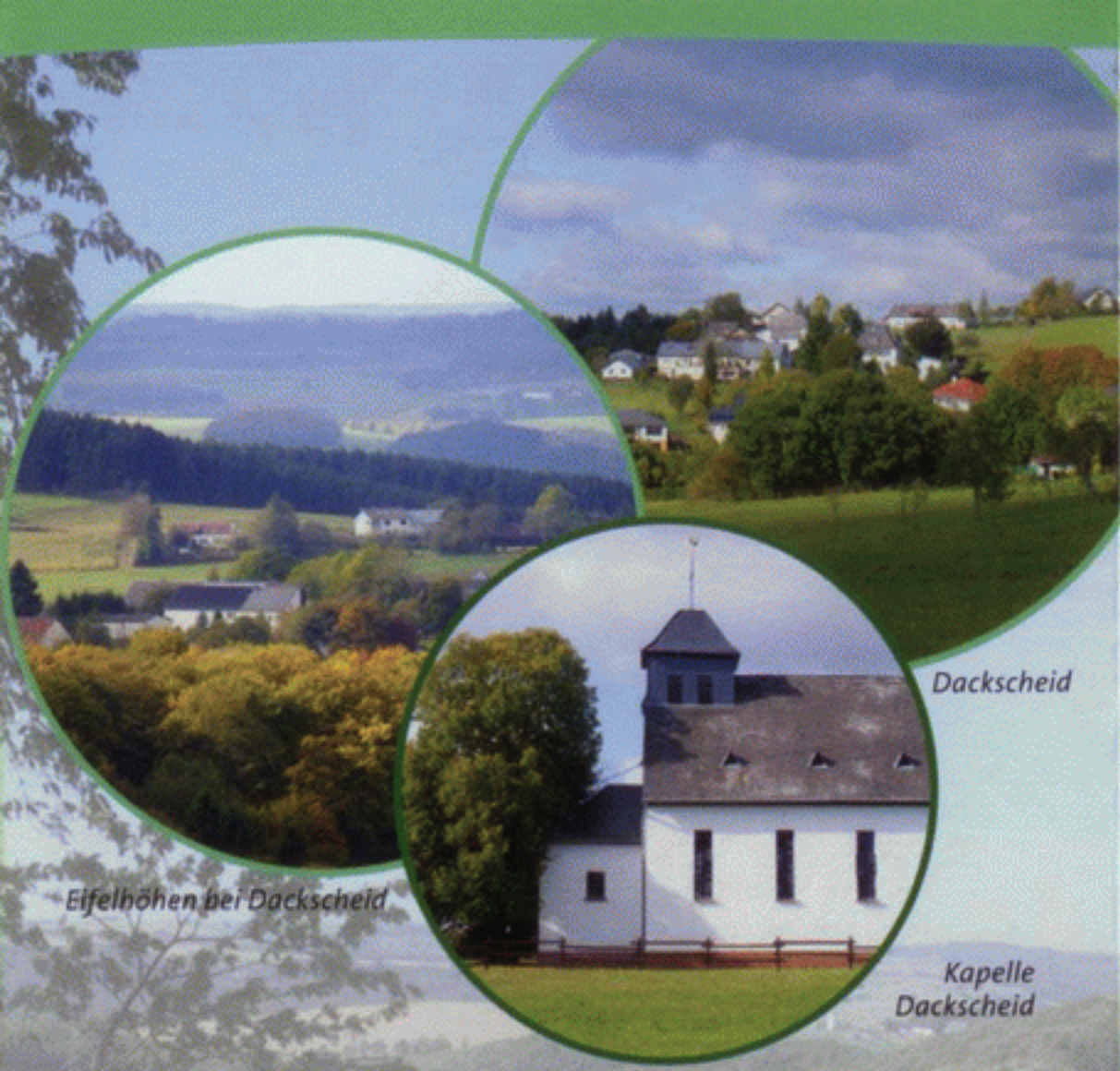
Eifelhöhen bei Dackscheid